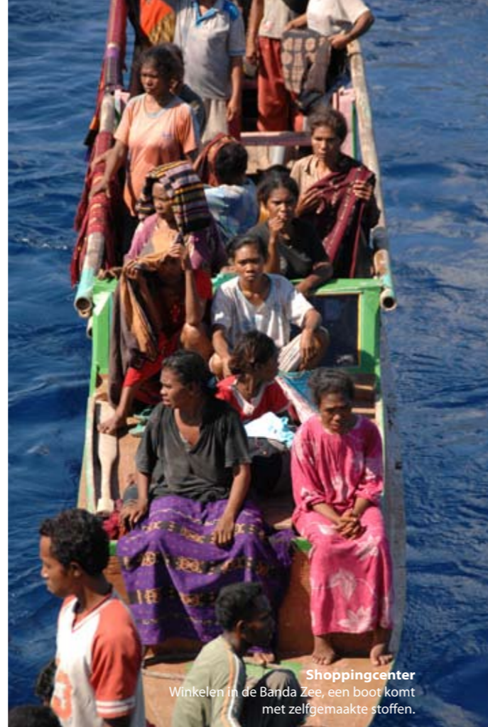
Shoppingcenter Winkelen in de Banda Zee, een boot komt met zelfgemaakte stoffen.

Doodziek voel ik me. Nog een paar dagen en mijn lot was hetzelfde geweest als dat van mijn schipgenoten. Minstens de helft van de bemanning is omgekomen gedurende de lange tocht naar ons einddoel, deze kleine eilandjes aan de andere kant van de wereld. Maar het is het allemaal waard, want hier wacht een rijkdom waar ik mijn hele leven al van heb gedroomd. Het is het jaar van de heer 1608 en we zijn aangekomen op Banda Neira, het nootmuskaateiland.